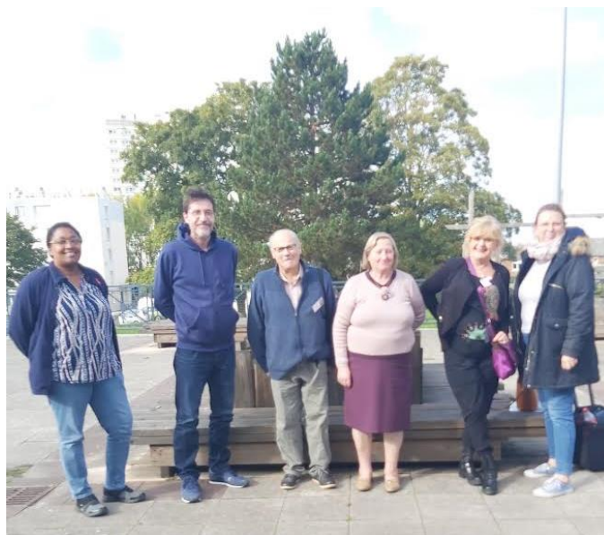
La visite des deux conseillères s'est terminée par la photo traditionnelle dans une ambiance détendue en face des locaux de Demain.

Par la suite, la plateforme « Ma Mobilité 62 » fut créée en septembre 2021 par le Conseil Départemental du Pas-de-Calais. Elle est dédiée à la mobilité, et a pour objectif de permettre aux bénéficiaires du RSA, jeunes de moins de 26 ans ou les demandeurs d'emploi de gagner en autonomie dans leurs déplacements. Pour ce faire, un accompagnement d'une durée de 4 mois est proposé aux personnes.